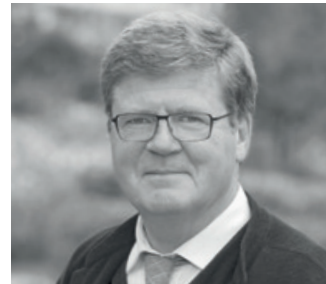
/ DIDIER ROBILIARD, PRÉSIDENT DE FRANCE PARKINSON

— L'UNISEP, Union contre la Sclérose En Plaques , réunit les forces pour lutter contre cette maladie grâce à ses associations d'aide aux patients et de recherche. Nous agissons également grâce à des actions de communication, pour lutter contre les préjugés et l'incompréhension dont sont victimes les personnes atteintes de la SEP. Symptômes visibles et invisibles, évolution imprévisible, phases de poussées et de rémissions, cette maladie neurologique de l'adulte jeune est déstabilisante pour tous. Si la sclérose en plaques est une maladie handicapante au quotidien, elle n'empêche pas pour autant de vivre. Au travers de ce livre, notre volonté est de prouver que tout le monde peut croire au bonheur.