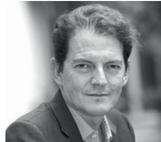
/ ALAIN DERBESSE, PRÉSIDENT DE L'UNISEP

— L'UNISEP, Union contre la Sclérose En Plaques , réunit les forces pour lutter contre cette maladie grâce à ses associations d'aide aux patients et de recherche. Nous agissons également grâce à des actions de communication, pour lutter contre les préjugés et l'incompréhension dont sont victimes les personnes atteintes de la SEP. Symptômes visibles et invisibles, évolution imprévisible, phases de poussées et de rémissions, cette maladie neurologique de l'adulte jeune est déstabilisante pour tous. Si la sclérose en plaques est une maladie handicapante au quotidien, elle n'empêche pas pour autant de vivre. Au travers de ce livre, notre volonté est de prouver que tout le monde peut croire au bonheur.